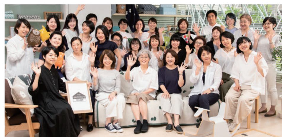
神宮前 5 丁目に移転後、2012 年にショップ「エコフォート」を open 写真は 2018 年、エコフォートショップでの全社員