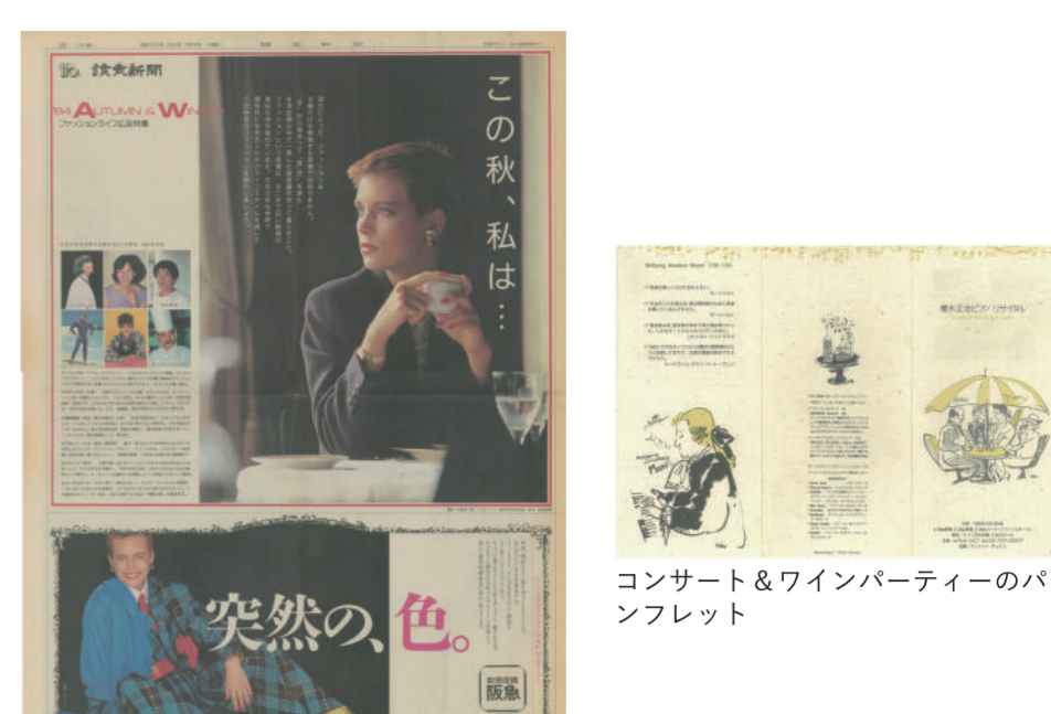
1984年9月 読売新聞 秋のファッション特集 8ページを企画・制作