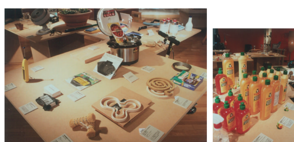
サステナブルデザイン展の展示。北欧と日本のキッチン商品コーナー