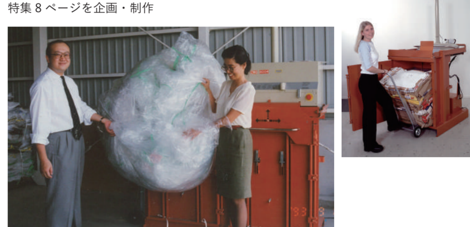
ORWAK 圧縮減容機にてビニール袋圧縮減容の実験