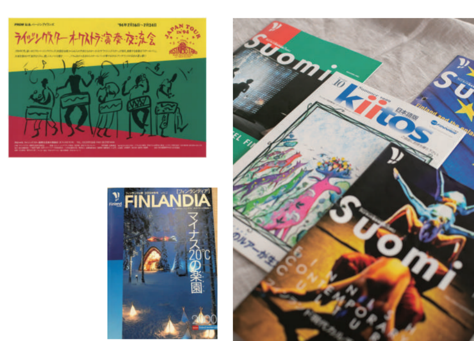
雑誌 CREA のフィンランド特集を取材・執筆したことがきっかけでフィンランドとのつながりが生まれた